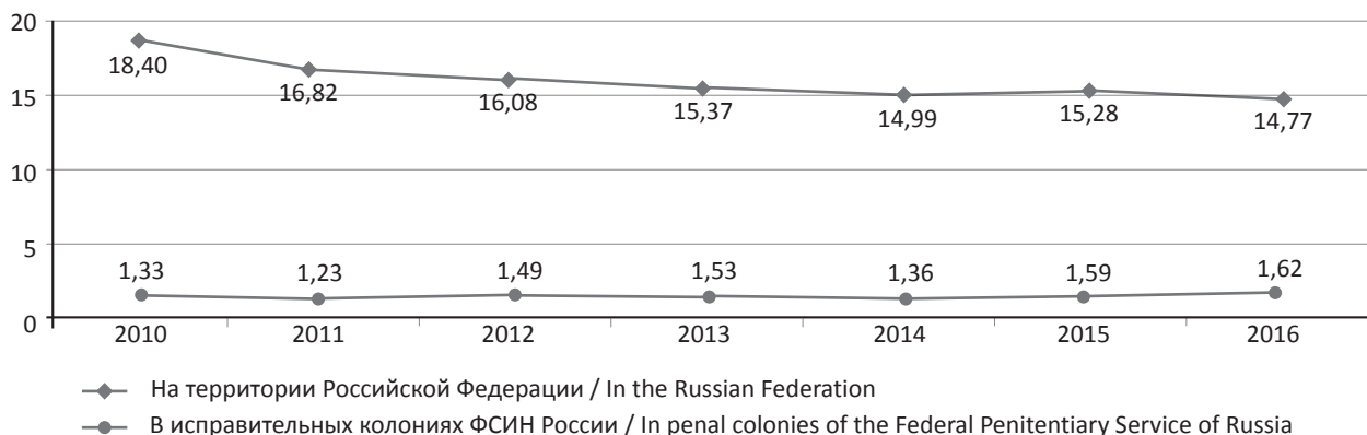
Рис. 2. Динамика коэффициента зарегистрированных в 2010–2016 гг. преступлений на 1 тыс. чел.