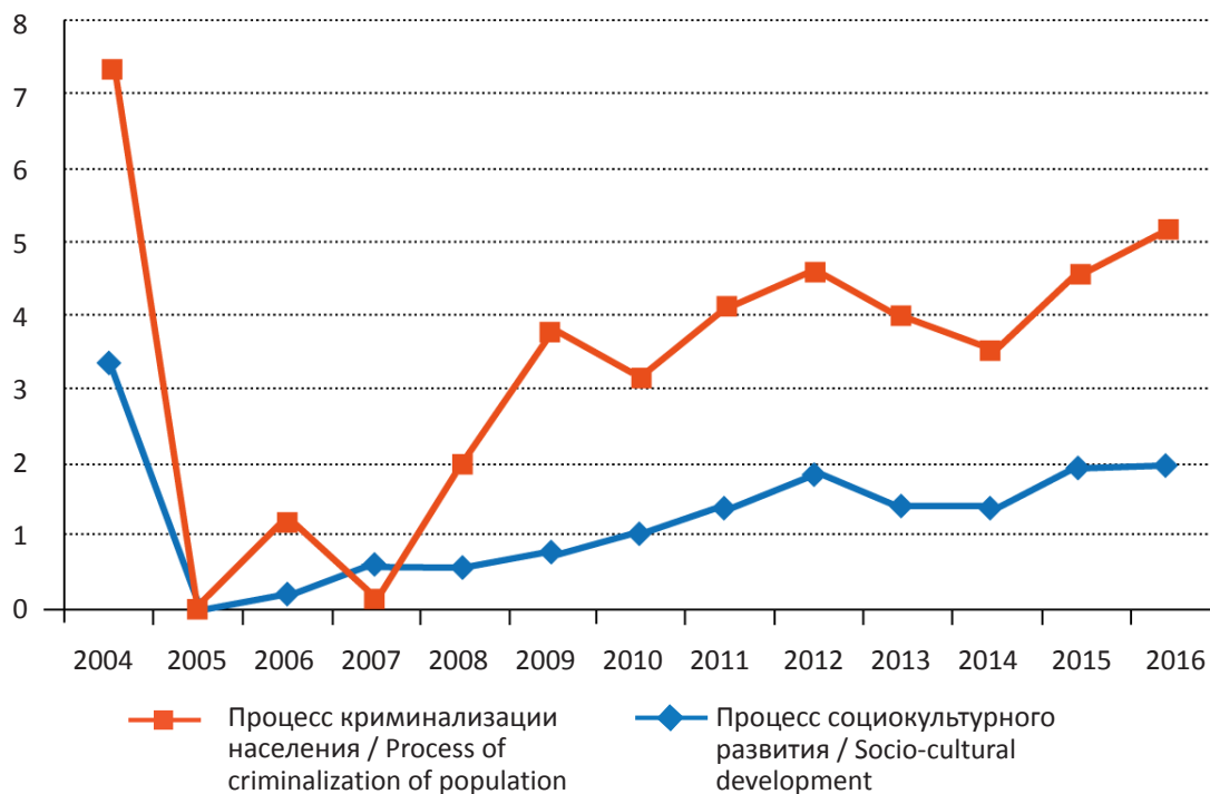
Рис. 2. Динамика результативности процессов социокультурного развития и криминализации населения в Забайкальском крае, баллов