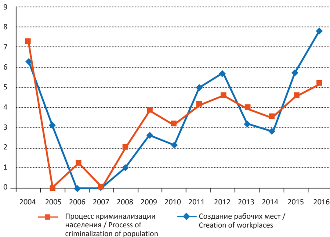
Рис. 3. Динамика результативности процессов создания рабочих мест и криминализации населения в Забайкальском крае, баллов