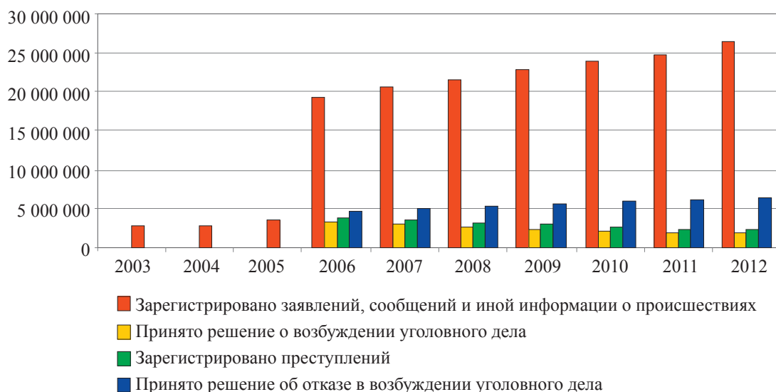
Рис. 1. Динамика преступности в России в 2003–2012 гг.

Из приведенных данных следует, что в России и Испании на каждую тысячу граждан приходится по пять полицейских. В таких странах, как Португалия, Италия, Турция, этот показа-