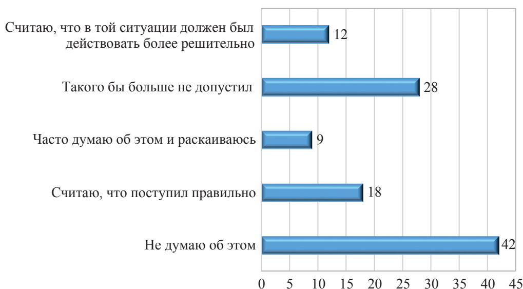
Рис. 4. Распределение ответов респондентов на вопрос: «Как Вы относитесь к тому, что Ваше участие, пусть и не преследуемое уголовным законом, могло облегчить кому-то совершение правонарушения?», %

Большинство криминальных агентов не задумывалось о своей негативной социальной роли (42 %). Почти треть опрошенных утверждает, что «такого бы больше не допустили» (28 %). Реакция раскаяния и сожаления отмечается лишь у 9 % респондентов, 18 %, напротив, убеждены в правильности собственных действий, а 12 % считают, что нужно было действовать более решительно.