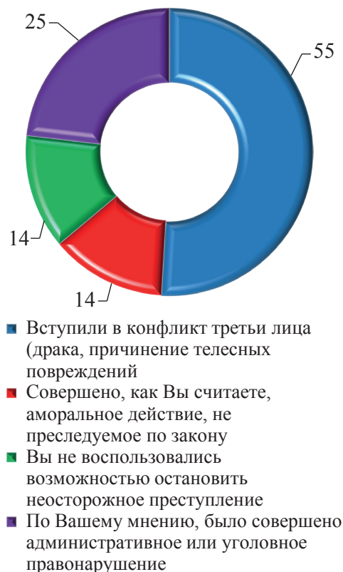
Рис. 2. Виды отклоняющегося, аморального или правонарушающего поведения, которое могли стимулировать криминальные агенты, %

поведения: для 55 % несомненна их роль в провокации побоев и телесных повреждений; две группы по 14 % опрошенных считают, что отчасти виновны в аморальных поступках, а также неосторожных преступлениях; 25 % согласились с тем, что не без их влияния было совершено административное или уголовное правонарушение (рис. 2).