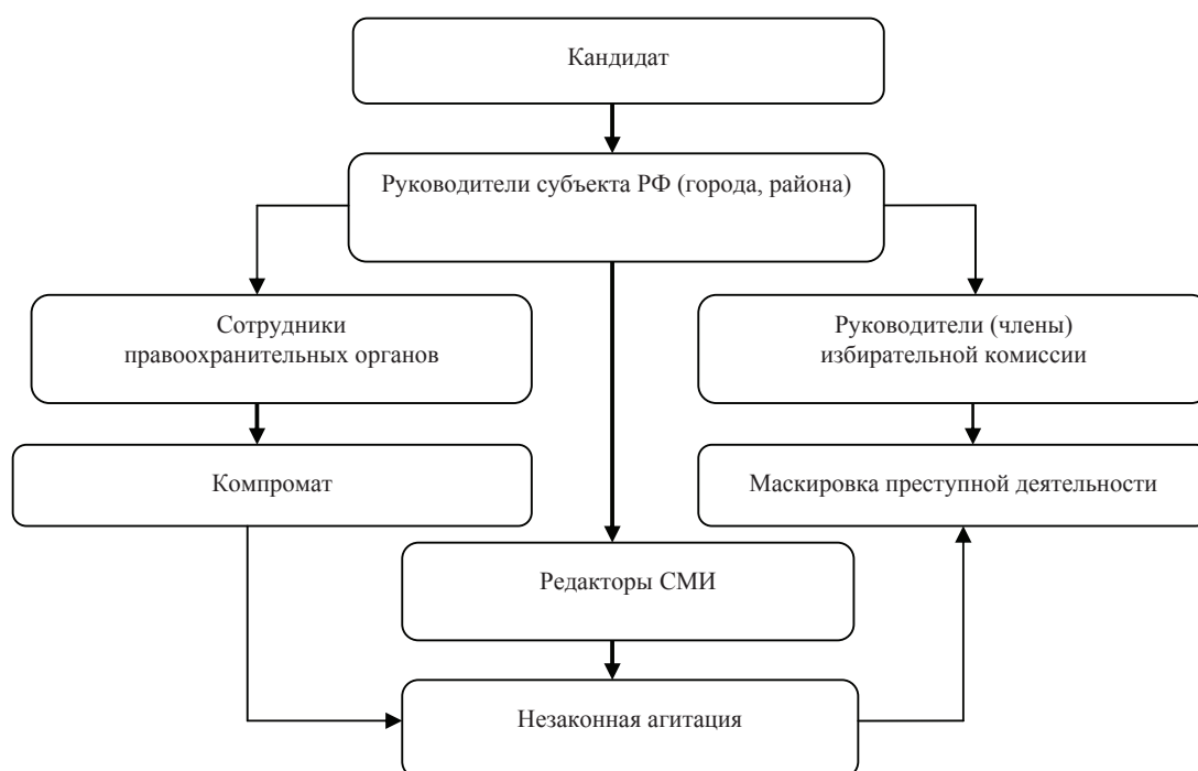
Рис. 3. Коррупционные связи кандидата

5. Коррупционные: между кандидатом и должностными лицами, ведущими агитацию в его пользу, членами избирательных комиссий, голосующими за принятие решений в его интересах, сотрудниками правоохранительных органов, поставляющих компрометирующую конкурентов информацию (рис. 3).