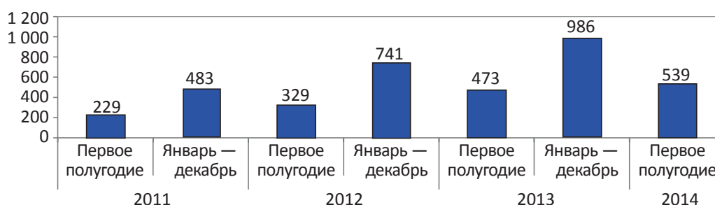
Рис. 1. Количество совершивших преступления лиц, занимающих должности в коммерческой или иной организации, связанные с выполнением управленческих функций, в 2011 — первом полугодии 2014 г., чел.

По мнению А.В. Данилова, среди всех преступлений экономической направленности наибольший имущественный ущерб юридическим лицам причиняют хищения, совершаемые путем присвоения и растраты [4].