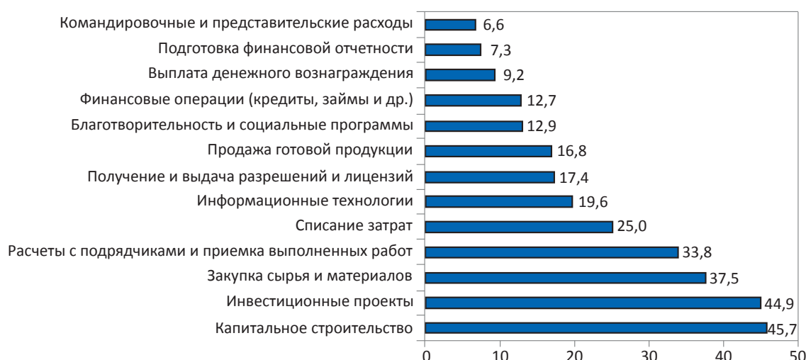
Рис. 2. Оценка потерь от злоупотреблений со стороны персонала российских компаний в разрезе основных бизнес-процессов, % от общих затрат на процесс (источник: [7])

Наиболее существенными угрозами и источниками потерь в российском бизнесе, по мнению экспертов ACFE, являются коррупция,