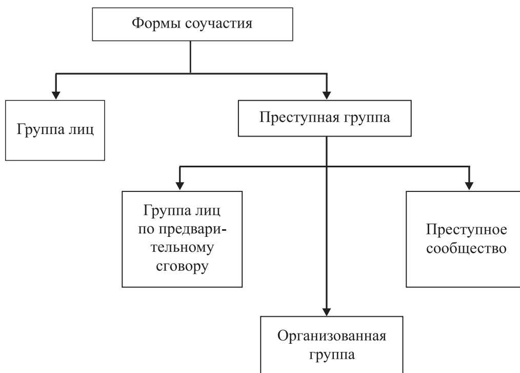
Рис. 2. Формы соучастия

а) внести изменения в нормы о соучастии, предусмотрев в ст. 35 УК РФ две формы соучастия с их последующим внутренним делением и регламентацией понятия преступной группы;