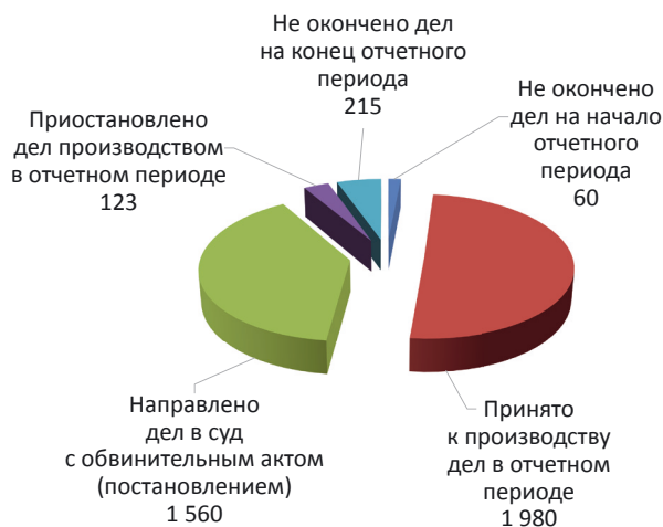
Рис. 5. Сведения об уголовных делах, находившихся в производстве дознания Управления ФССП России по Красноярскому краю, за январь — сентябрь 2014 г.

Как видно из практики Красноярского края, сложившейся в том числе из требований районных, городских прокуратур, предъявляемых при решении вопроса о возбуждении уголовного дела, сроки уклонения должников от уплаты алиментов с момента вручения должнику предупреждений об уголовной ответственности по ч. 1 ст. 157 УК РФ до возбуждения уголовного дела варьируются от одного месяца до одного года. Началом злостного уклонения считается день вручения должнику первого предупреждения, а моментом его окончания — возбуждение уголовного дела. Справедливости ради следует отметить, что закон не требует предупреждения, тем более многократных предупреждений должника об уголовной ответственности. Количество таких предупреждений не может являться определяющим в установлении вины лица,