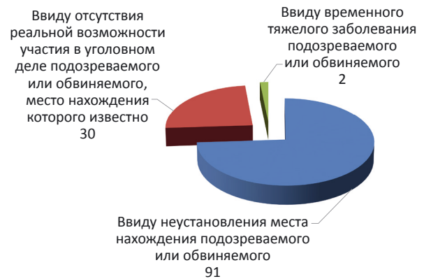
Рис. 6. Сведения об уголовных делах, производство дознания по которым приостановлено в отчетном периоде (январь — сентябрь 2014 г.), по Красноярскому краю