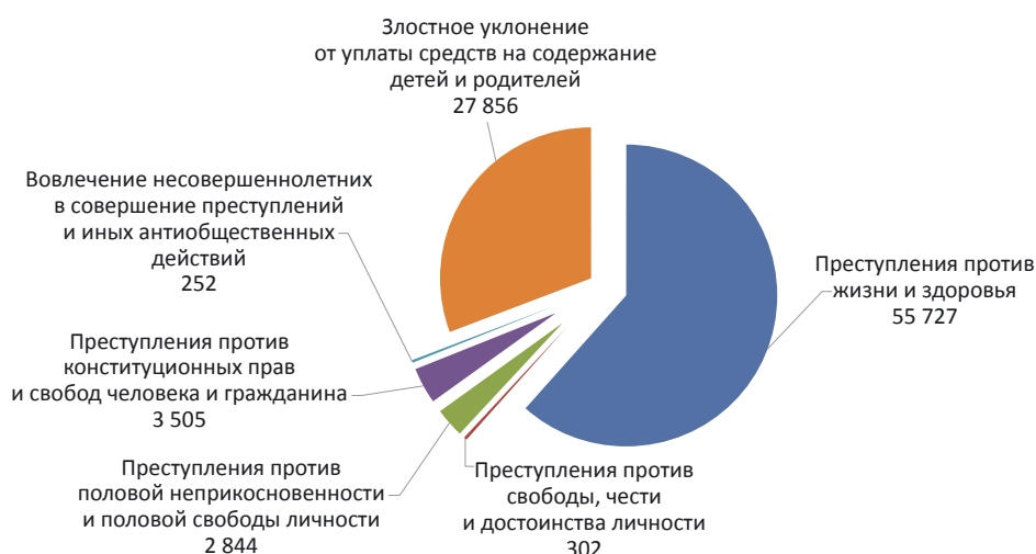
Рис. 1. Статистические сведения о количестве осужденных за преступления против личности за первое полугодие 2014 г. (по данным Судебного департамента при Верховном Суде РФ), чел.