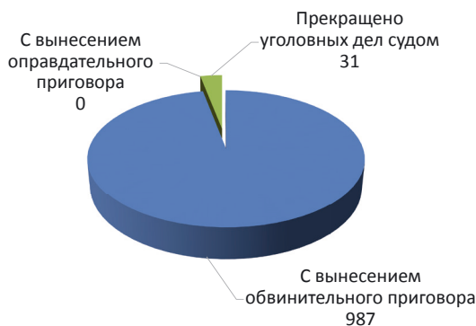
Рис. 4. Количество рассмотренных уголовных дел в суде по ст. 157 Уголовного кодекса РФ за январь — сентябрь 2014 г. в Красноярском крае