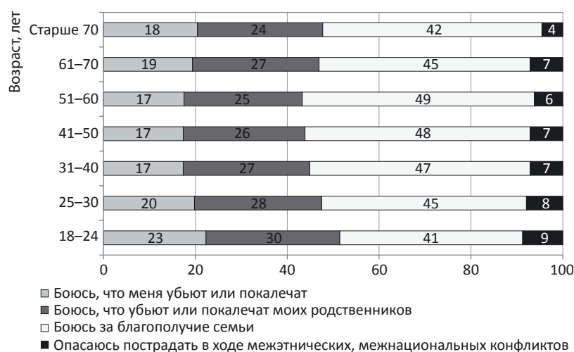
Рис. 2. Особенности восприятия социальных рисков и криминальных угроз различными возрастными группами населения, % от общего числа опрошенных

Рассмотрим категории преступных посягательств, вызывающих наибольшую тревогу у граждан. Восприятие и оценка конкретных опасений отражают не только объективную реальность, но и определенный культурно-исторический опыт, систему ценностных ориентаций, ментальных установок, сложившихся в обществе [10]. В данном аспекте весьма закономерным является тот факт, что наибольшую угрозу для российского населения представляют водители, находящиеся в состоянии алкогольного