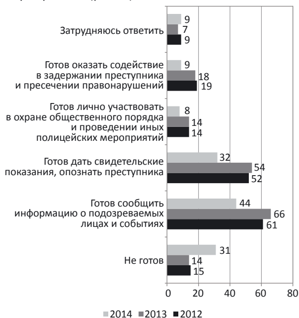
Рис. 4. Распределение ответов на вопрос: «Готовы Вы или нет в определенных ситуациях оказать помощь сотрудникам полиции? Если да, то каким образом?» в 2012–2014 гг., % от общего числа опрошенных

лика» [18]. Почти каждый третий опрошенный (31 %) отметил, что не готов оказывать помощь сотрудникам полиции. Что касается различных аспектов сотрудничества, в большей степени граждане готовы сообщать информацию о подозрительных лицах и событиях (44 %), предоставлять свидетельские показания, опознавать преступников (32 %), выступать в качестве понятых (28 %), сообщать информацию о правонарушениях экстремистского и террористического характера (18 %). Относительно более активных форм сотрудничества можно отметить, что здесь уровень готовности граждан значительно ниже: 9 % могли бы оказать содействие в задержании преступника и пресечении правонарушений, 8 % — лично участвовать в охране общественного порядка и проведении иных полицейских мероприятий (рис. 4).