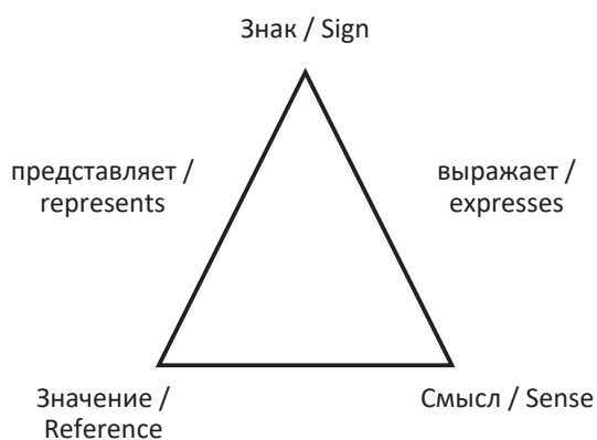
Рис. 2. Семантический треугольник Фреге Fig. 2. Gottlob Frege's Semantic Triangle

Во-вторых, похожую модель трансформации смысла чего-либо через знаки предложил Готлоб Фреге в своем треугольнике (рис. 2).