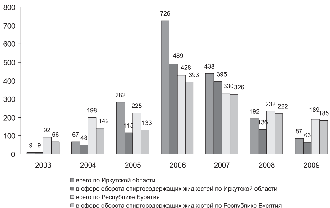
Рис. 1. Сведения о количестве уголовных дел, возбужденных по ст. 238 УК РФ в 2003–2009 гг., в том числе в сфере оборота спиртосодержащих жидкостей, по Иркутской области и Республике Бурятия

Более высокие региональные показатели официальной статистики МВД Республики Бурятия можно объяснить, прежде всего, большей активностью соответствующих структурных подразделений в выявлении таких преступлений, которая была детерминирована особенностями нелегального рынка сбыта спиртосодержащих жидкостей (рис. 1). Так, на территории Бурятии нет и не было гидролизных заводов, изготавливающих эти-